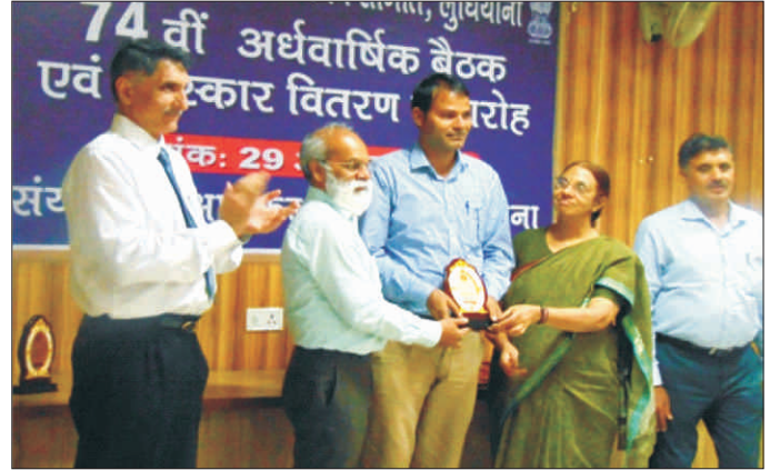
'छोटे कार्यालय' की श्रेणी में वर्ष भर सर्वाधिक कार्य का निष्पादन हिंदी में करने पर तीसरा स्थान पुरस्कार प्राप्त

संस्थान प्रबंधन समिति की 10वीं बैठक दिनांक 11 सितंबर, 2018 को लुधियाना में डॉ.