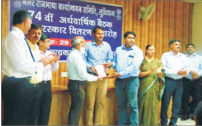
हिंदी पत्रिका 'कृषि चेतना' प्रकाशित करने पर नराकास द्वारा सम्मानित

उन्हें नमन किया और भावपूर्ण श्रद्धांजलि अर्पित की। इसके उपरान्त कार्यकारी निदेशक महोदय ने उनकी जीवनी पर प्रकाश डालते हुए उनकी जीवन शैली और उनके व्यक्तित्व की प्रशंसा की। उपस्थित कर्मचारियों ने अटल जी के काव्य सागर से उन्ही को काव्यांजलि अर्पित कर श्रद्धांजलि दी। माननीय अटल जी का भारत निर्माण में अतुलनीय योगदान हम सबके लिए पथप्रदर्शक है। उनके व्यक्तित्व की महानता हमेशा हमेशा के लिए भारतीयों के हृदयों में गौरवशाली प्रेरणा के रूप में फूलती फूलती रहेगी।