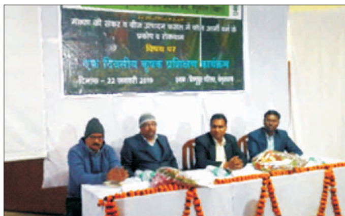
एफएडब्ल्यू पर सुग्राहीकरण कार्यशाला Sensitization workshop on FAW

सचिव, डेयर और महानिदेशक, भाकृअनुप की अध्यक्षता में दिनांक 20 अगस्त, 2018 को कृषि भवन, नई दिल्ली में फाल अर्मीवार्म पर एक उच्च स्तरीय बैठक आयोजित की गई। सचिव, डीएसी और एफडब्ल्यू की अध्यक्षता में दिनांक 14 नवंबर को कृषि भवन में एक और उच्च स्तरीय बैठक हुई। फाल अर्मीवार्म पर राज्य पदाधिकारियों के सुग्राहीकरण के लिए 16 नवंबर का कोलकाता में और 29 नवंबर को पटना में जागरूकता कार्यशालाएं आयोजित की गईं। प्रमुख मक्का उत्पादक जिलों से जिला अधिकारियों ने कार्यशालाओं में भाग लिया।