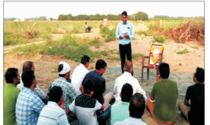
भारत रत्न माननीय अटल बिहारी वाजपेयी जी की प्रथम मासिक पुण्य-तिथि पर श्रद्धांजलि