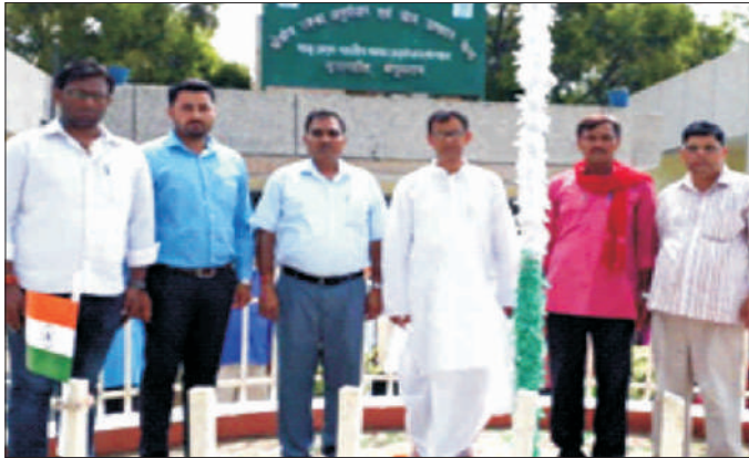
स्वतंत्रता दिवस पर राष्ट्रीय ध्वजारोहण National Flag hoisting on Independence day

संस्थान के सभी केंद्रों में 71वां स्वतंत्रता दिवस पूरे उत्साह के साथ मनाया गया। इस अवसर पर प्रेरणादायी अभिभाषण के साथ देश भक्ति गीत का गायन किया गया। निदेशक ने क्षेत्रीय मक्का अनुसंधान और बीज उत्पादन केंद्र, बेगुसराय में राष्ट्रीय ध्वज फहराया।