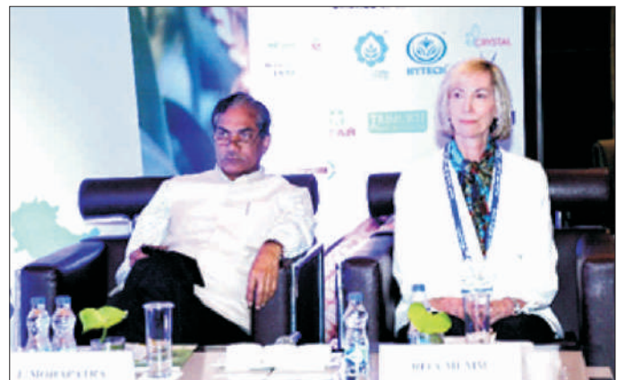
एशियाई मक्का सम्मेलन 2018 की कुछ झलकियां Some glimpses of Asian Maize Conference 2018