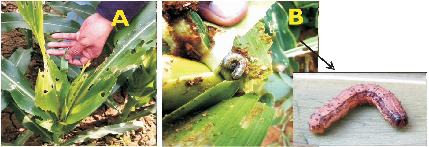
(A) एफएडब्ल्यू क्षतिग्रस्त मक्का, (B) प्लांट होर्ल में एफएडब्ल्यू लार्वा फीडिंग (A) FAW damaged maize, (B) FAW larva feeding in plant whorl