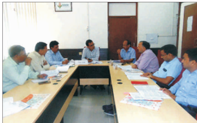
आईएमसी के सदस्य कार्यसूची मदों पर चर्चा करते हुए The IMC members discussing the agenda items

vehicle approved under SFC 2017-20, and extension of existing entomology laboratory, at WNC, Hyderabad. The meeting ended with vote of thanks by the secretary, IMC.