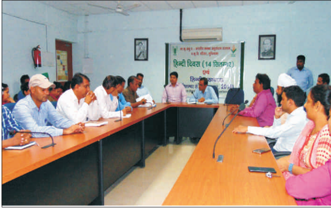
राजभाषा पखवाड़ा समापन समारोह