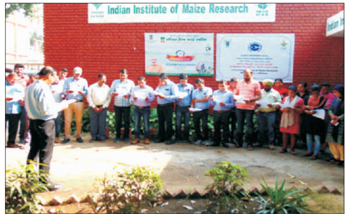
भामअनुस सदस्य सत्यनिष्ठा शपथ लेते हुए

The Vigilance Awareness Week was organized from 29 th October to 3 rd November 2018. Integrity pledge was taken by staff members at all the centres of the institute. Some events such as debate, essay and quiz competitions were organised during this period. Institute integrity pledge was registered online and online integrity pledge at individual level was encouraged. Certificates were distributed to the winners of various competitions during the closing ceremony held on 3 rd November 2018.