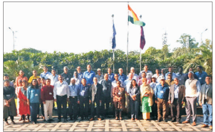
एचटीएमए परियोजना दल The project team of HTMA

A USAID sponsored multi-organization project entitled "High temperature tolerant maize for Asia (HTMA)" was launched on 11 th October, 2018 at Ludhiana. The meeting was organized by CIMMYT India. A total of 20 participants from public and private sectors from different Asian countries including India, Pakistan, Bangladesh, Bhutan and Nepal, CIMMYT, USAID and Perdue University attended the launch programme.