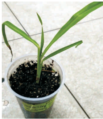
DMRH 1308 में पुनरुत्पादन Regeneration in DMRH 1308