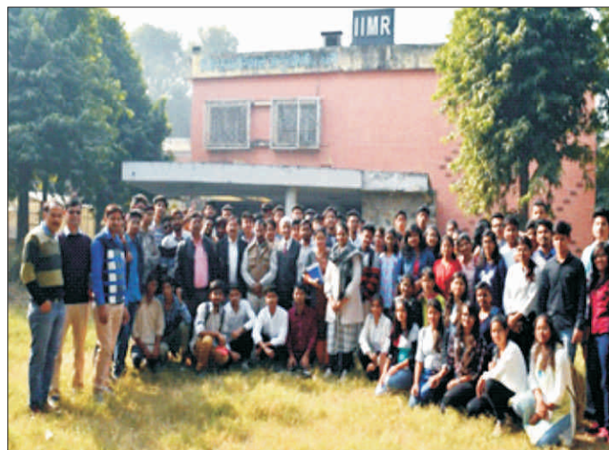
भामअनुसं में जी डी गोयनका विश्वविद्यालय के छात्र Students of G. D. Goenka University at IIMR