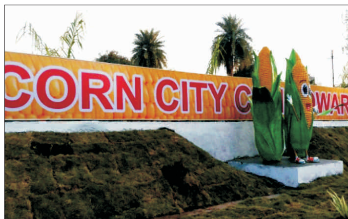
कॉर्न महोत्सव की कुछ झलकियां