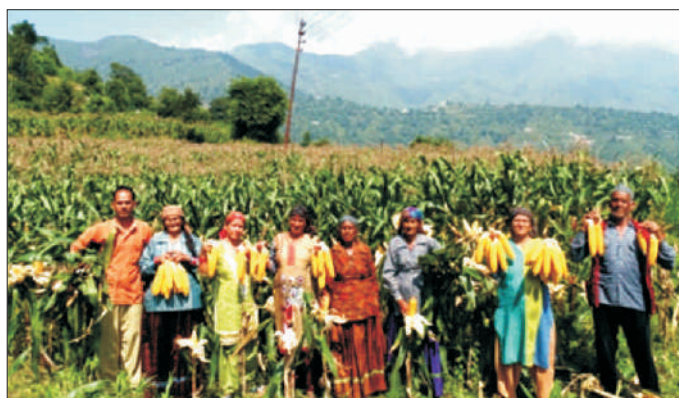
देहरादून (उत्तराखण्ड) में किसान विवेक संकर मक्का की उपज का प्रदर्शन करते हुए Farmers showing produce of Vivek Hybrid Maize at Dehradun district of Uttarakhand

भारत सरकार के राष्ट्रीय खाद्य सुरक्षा मिशन के अंतर्गत पूरे भारतवर्ष में 13 केंद्रों पर कुल 173.4 हैक्टे. क्षेत्रफल में अग्रपंक्ति प्रदर्शन आयोजित किए गए। इन प्रदर्शनों से 12 राज्यों, बिहार, जम्मू एवं कश्मीर, कर्नाटक, मध्य प्रदेश, मणिपुर, मेघालय, पंजाब, राजस्थान, तेलंगाना, तमिलनाडु, उत्तर प्रदेश और उत्तराखंड में 472 किसान लाभान्वित हुए। इन प्रदर्शनों में 11.1 किंटल प्रति हैक्टे. की अधिक औसत उपज प्राप्त की गई, जो किसानों की वर्तमान विधियों की तुलना में 31.9 प्रतिशत अधिक थी। औसत उपज में अंतर बिहार में 5.5 प्रतिशत से मणिपुर में 197.9 प्रतिशत तक था।