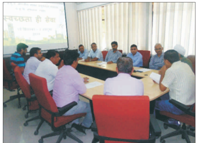
स्वच्छता ही सेवा अभियान और स्वच्छता पखवाड़ा के तहत आयोजित कुछ गतिविधियां Some activities conducted under Swachhata Hi Sewa campaign and Swachhata Pakhwara