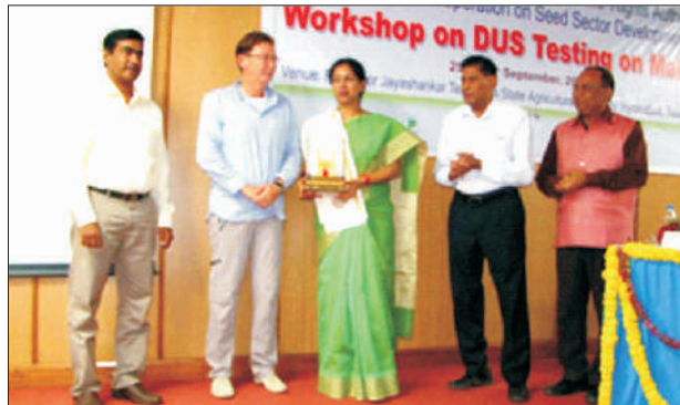
महानुभाव एक प्रतिभागी का अभिनंदन करते हुए The dignitaries felicitating a participant during DUS workshop on Maize