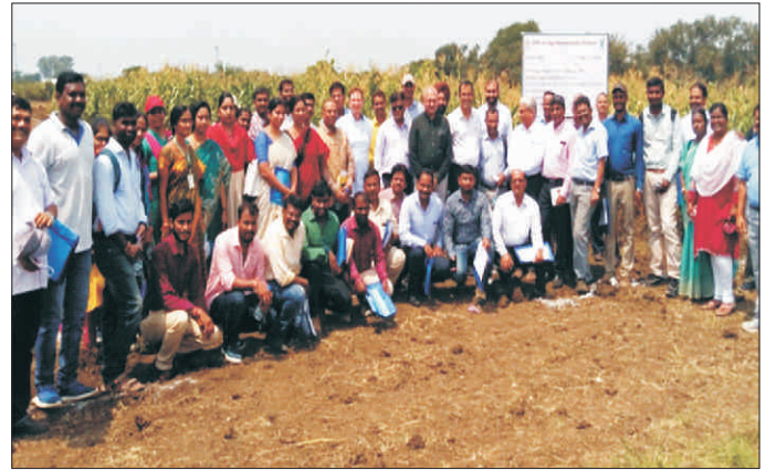
मक्का जननद्रव्य फील्ड दिवस के प्रतिभागी Participants of the Maize Germplasm Field Day