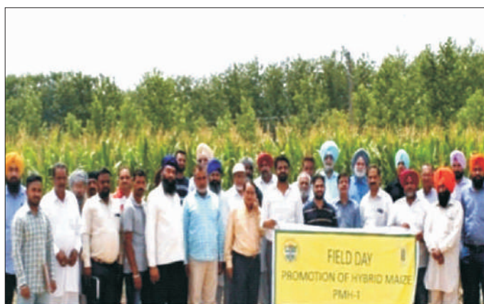
पंजाब में संकर मक्का (पीएमएच 1) को बढ़ावा देने के लिए फिल्ड दिवस का आयोजन Field day on promoting maize hybrid (PMH 1) in Punjab