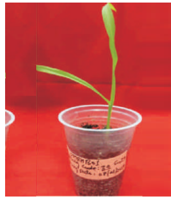
DMRH 1301 में पुनरुत्पादन Regeneration in DMRH 1301